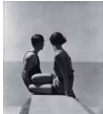
George Hoyningen-Huene, George Hoyningen-Huene mit Modell in Schwimmkleidung von Izod , 1930, Silbergelatine, Fotografische Sammlung Museum Ludwig, Schenkung Vogue