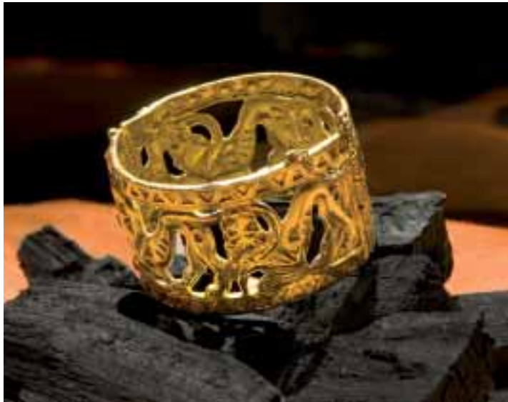
Baktrischer Armring mit stilisierten Löwen, 4./2. Jahrhundert v. Chr., Sammlung Diergardt.

Schmuck der Antike und der Völkerwan- derungszeit aus Deutschland und Europa. Fränkische Funde aus Köln und dem Rheinland.