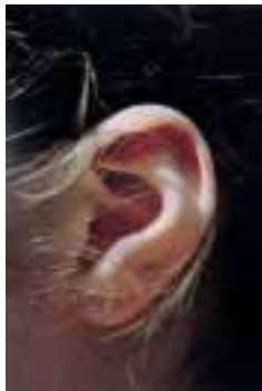
Isa Genzken, Ohr , 1980, Photograph, Sammlung Charles Asprey

Sammlungsschwerpunkte: Deutscher Expressionismus, Russische Avantgarde, Surrealismus, Picasso, Pop Art, Gegenwartskunst, Grafik und Fotografie.