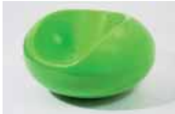
Sessel „Pastille“ grün, Polyester, fiberglasverstärkt Eero Aarnio 1967, Asko Lahti, Finnland

Das Museum bietet mit seiner neuen Dauer- ausstellung „Kunst und Design im Dialog“ die Möglichkeit, Design in enger Beziehung zu Werken der Bildenden Kunst zu betrachten. Zwei Etagen zeigen Schlüsselwerke von Design- ern wie Frank Lloyd Wright, Charles und Ray Eames oder Philippe Starck neben herausra- genden Gemälden etwa von Piet Mondrian oder Wassilij Kandinsky. Ermöglicht hat diese Kon- zeption die Schenkung der privaten Sammlung Winkler. Das Ausstellungskonzept stammt vom Vitra Design Museum in Weil am Rhein.