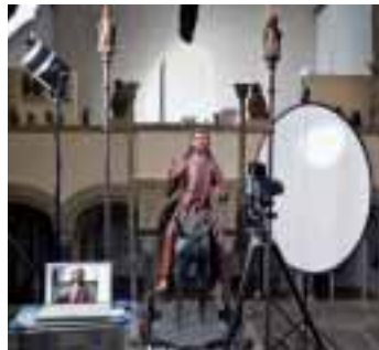
Fotografen des Bildarchivs bei der Arbeit im Museum Schnütgen: Aufnahme des Christus auf dem Palmesel, um 1520

In rund 750.000 Schwarzweißnegativen und ca. 25.000 Farbaufnahmen dokumentiert das Rheinische Bildarchiv den Kunstbesitz der Kölner Museen sowie die allgemeine Kunst- und Kulturgeschichte der Stadt Köln und des Rheinlandes. Außerdem verwaltet das Archiv Bestände von August Sander, August Kreyen- kamp, Karl Hugo Schmölz, Chargesheimer und anderen Fotografen. S/W Abzüge und Scans werden gegen Rechnung geliefert.