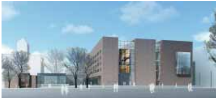
Das neue Kulturquartier: Rautenstrauch-Joest-Museum und Museum Schnütgen (Eröffnung voraussichtlich Sommer 2010).

Das Museum Schnütgen wird im neuen Doppel-museum einen einzigartigen Blick auf die Wurzeln unserer christlichen Kultur bieten. Mit kostbarsten Kunstwerken werden das Leben im Mittelalter und der christliche Glaube dargestellt. Die Sammlung bietet nicht nur einen lebendigen Überblick über die wichtigsten Themen dieser sieben Jahrhunderte. Mit einer Fülle an Spitzenstücken gehört das Museum Schnütgen zu den zehn wichtigsten Museen alter Kunst in Europa. Diese Werke werden zukünftig im Neubau, im Anbau von Karl