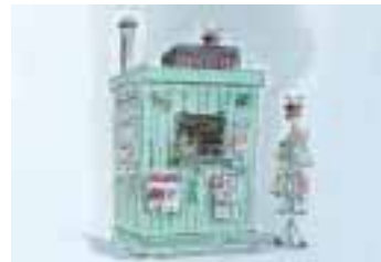
Das Büdchen als Sammelstelle und Informationsquelle für die Skandälchen der Stunksitzung

in Zusammenarbeit mit »Arge KulturIdee« Anfang der 1980er Jahre stieß der Sitzungs- karneval mit seinen erstarrten Formen und prunk- vollem Gehabe vor allem beim jüngeren Publikum auf Desinteresse und führte zur Abkehr vom tradi- tionellen Brauchtum. 1984 wurde als Experiment einer Studentengruppe unter dem Motto „Karneval