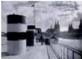
August Sander: Jungfernfahrt eines Rheindampfers

Museum Zündorfer Wehrturm Hauptstraße 180, 51143 Köln (Porz-Zündorf) Telefon 02203 / 85250 info@zuendorfer-wehrturm.de Geöffnet mittwochs und samstags 15 - 18 Uhr, sonntags 14 - 18 Uhr