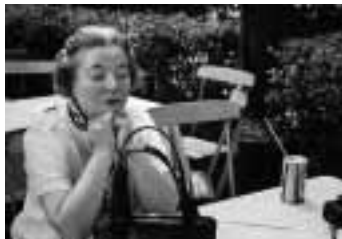
Gabriele und Helmut Nothhelfer: Dame beim Pfingstkonzert im Zoologischen Garten, Berlin 1974, © Gabriele und Helmut Nothhelfer, VG Bild-Kunst, Bonn 2009

Die Ausstellung des niederländischen Konzept-Künstlers und Photographen Hans Eijkelboom mit Bildern aus den drei Weltstädten Paris, New York, Shanghai ist aus seinem Projekt Photo Notes