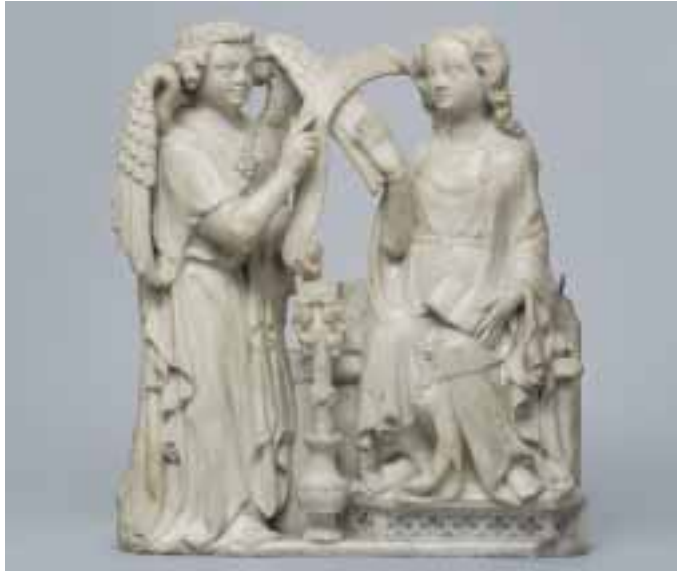
Verkündigung an Maria vom Hochaltar des Kölner Domes, um 1310, Köln, Museum Schnütgen

Christliche Kunst vom 4. bis zum 20. Jahrhundert, Werke der Schatzkunst aus Gold, Silber, Bronze, Elfenbein. Reliquiare, liturgische Geräte und Textilien, Insignien der Erzbischöfe und Geistlichen, mittelalterliche Skulpturen und fränkische Grabfunde.