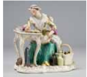
Rechnende Kaufmannsfrau, um 1755, Modell von Johann Joachim Kaendler © Marion Mennicken / Rheinisches Bildarchiv

Die bedeutendste europäische Porzellanmanu- faktur des 18. Jahrhunderts wurde am 23. Januar 1710 durch den sächsischen Kurfürsten und König von Polen, August den Starken, gegründet. Per Dekret ließ er die Erfindung des Porzellans sowie die Gründung einer Porzellan-Manufaktur in Sachsen feierlich verkünden. Die Produktion wurde noch im Juni desselben Jahres auf der Albrechtsburg in Meißen aufgenommen; das