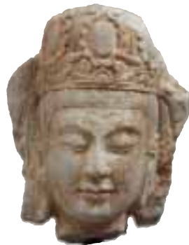
Kopf eines Bodhisattva, Kalkstein, China, Nördliche Qi-Dynastie (550-577), Privatsammlung Schweiz