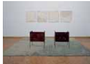
Franz West, Plural, 1995, Zwei Sessel: Eisen, Holz, Farbe, vier Gemälde: Dispersion auf Leinwand, Boden: Linoleum, Rhein. Bildarchiv, Köln

Das Museum zeigt die erste große Retrospektive von Franz West in Europa. Die Ausstellung entsteht in enger Zusammenarbeit mit dem Künstler sowie mit seinem Atelier und Archiv. Über 80 Arbeiten aus allen Schaffenszeiten und in den verschiedensten Medien und Techniken zeigen