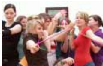
Aus dem Workshop "Wie präsentiere ich mich richtig?" des Museumsdienstes Köln im Museum Ludwig, © Karin Rottmann

Jeden Sonntag eine Führung für Familien. Und in den Schulferien spezielle Programme.