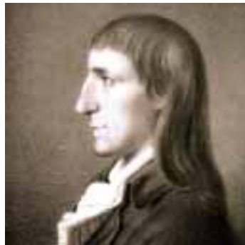
Johann Christoph Friedrich GutsMuths

Das Deutsche Sport & Olympia Museum bietet auf attraktive Weise Einsichten in die Geschichte und den Wandel des Sports. Durch die Kombination von Originalobjekten mit multimedialer Technik und die Inszenierung historischer und atmosphärischer Bilder wird der Besuch zu einem außergewöhnlichen Erlebnis; der höchste Sportplatz Kölns auf dem Museumsdach sowie diverse Aktivstationen in der Ausstellung laden darüber hinaus zur sportlichen Betätigung ein.