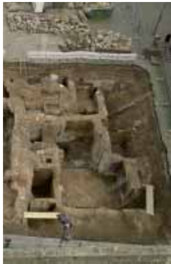
Zeugnisse römischer und mittelalterlicher Besiedlung auf der Südseite des Rathausplatzes

Die Preisträger des internationalen Architekten Wettbewerbs planen bereits die Archäologische Zone mit einem jüdischen Präsentationsschwerpunkt auf dem Rathausplatz. 2012/2013 wird Kölns neue museale Attraktion der Öffentlichkeit übergeben. Schon jetzt gewähren die Ausgrabungen auf dem Rathausplatz tiefgehende Einblicke in die Vergangenheit der Stadt.