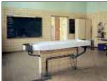
Amnésia: autopsies

Gedenkstätte Gestapogefängnis: ehemaliges Gestapogefängnis mit dem Zellentrakt und den Inschriften der Gestapohäftlinge Dauerausstellung „Köln im Nationalsozialismus“, wechselnde Sonderausstellungen, Bibliothek