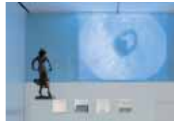
Eingangszone des Tanzarchivs, Foto: Susanne Fern

Im Mittelpunkt der Ausstellung stehen die frühen Jahre des Wuppertaler Tanztheaters. Dabei wählen die Kuratoren wieder eine ungewöhnliche Art der Annäherung an das Thema: im Focus steht Pina Bauschs früherer Lebensgefährte und kongenialer Bühnen- und Kostümbildner, Rolf Borzick, der die Arbeit der wohl berühmtesten Choreographin aus Deutschland in jenen Jahren prägte