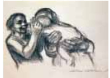
Käthe Kollwitz, Mutterglück , 1931, Kreidelithographie