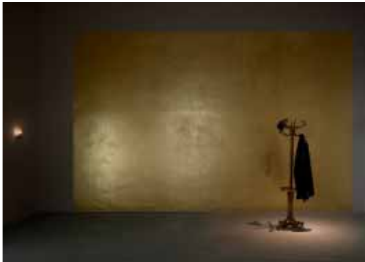
Immer ausgestellt: Jannis Kounellis, Tragedia Civile (Bürgerliche Tragödie), 1975

Die Sammlung reicht von der Spätantike bis in die Gegenwart, von romanischer Skulptur bis zur Rauminstallation, von mittelalterlicher Tafelmalerei bis zum »Radical Painting«, vom gotischen Ziborium bis zum Gebrauchsgegenstand des 20. Jahrhunderts. Die Suche nach einer übergreifenden Ordnung, nach Maß, Proportion und Schönheit ist als Element künstlerischer Gestaltung der Leitfaden.